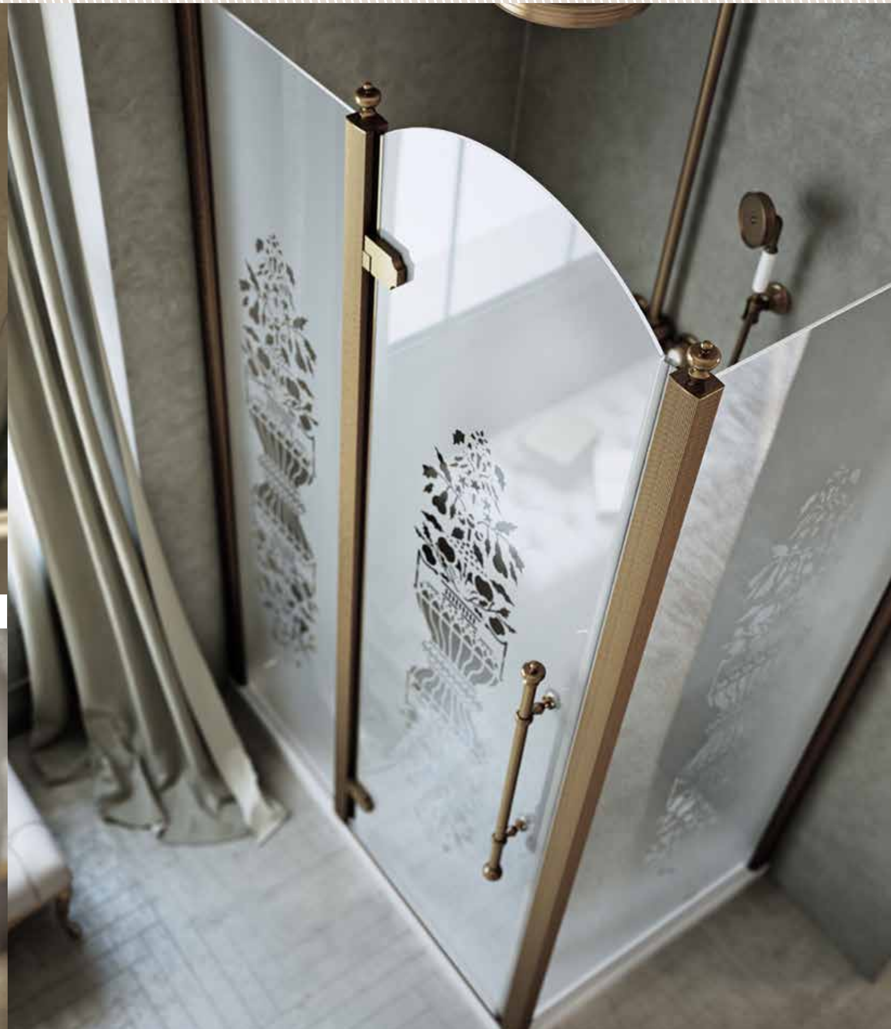
PP AMYD 80X120 BRO SR3 bronzo spazzolato a mano | hand-made brushed bronze | Бронза, шлифованная вручную