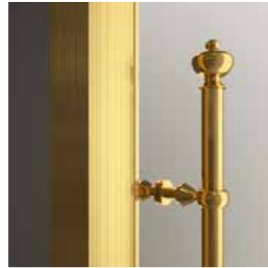
DOR placcato oro 24K Gold plated 24K Позолота 24k