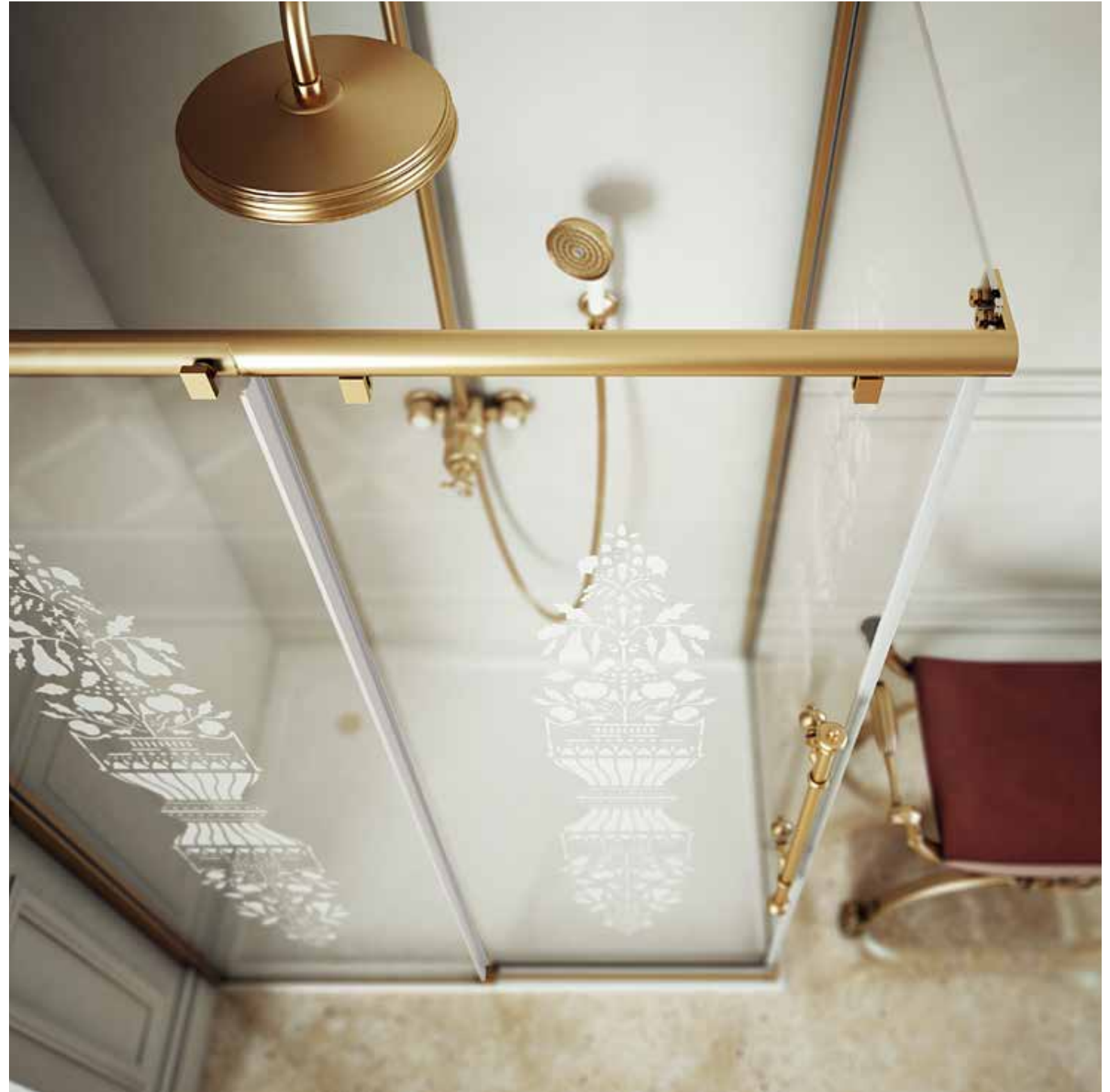
LE ANSS 80X120 BRX SR1 bronzo | bronze | Бронза