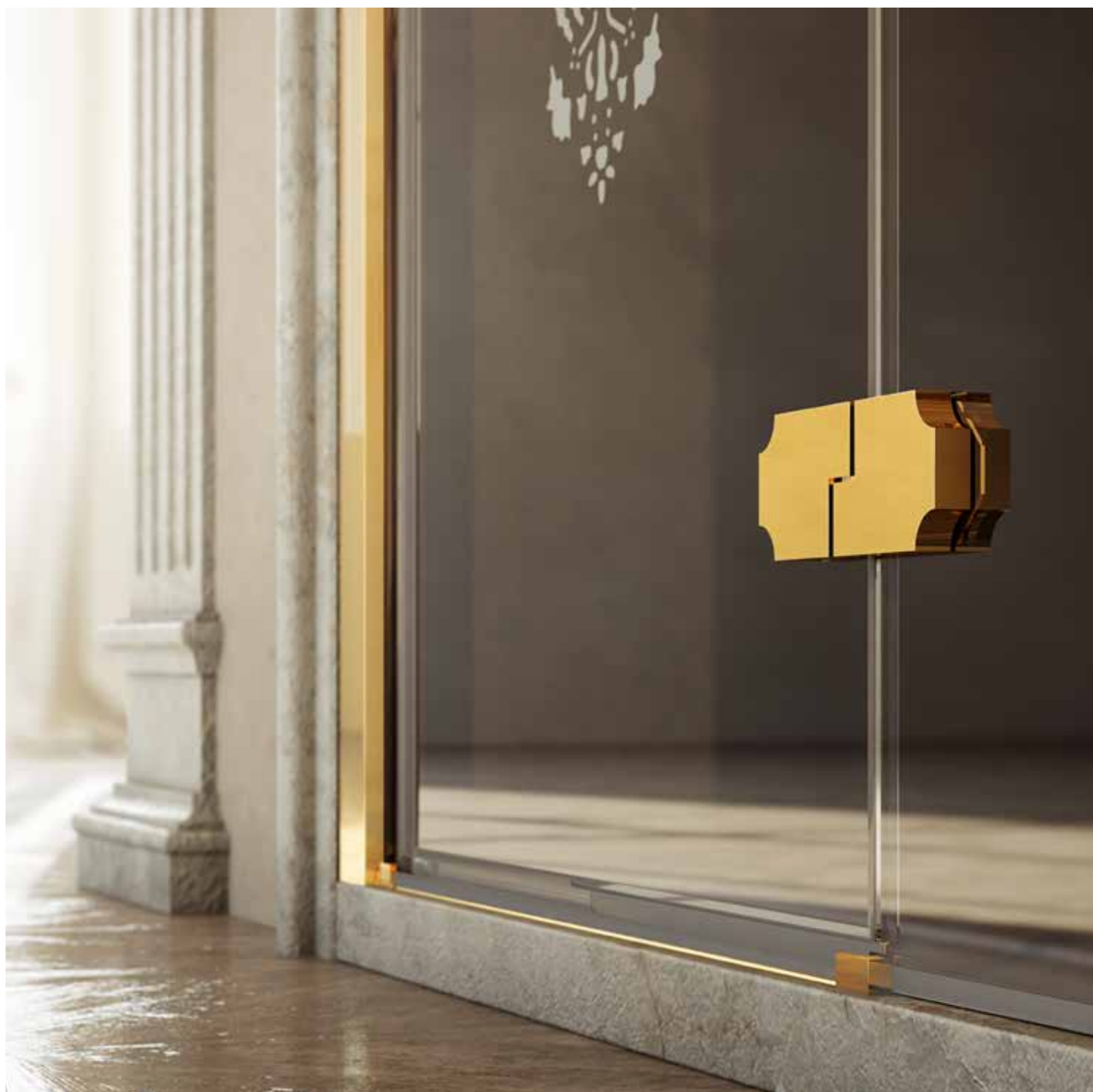
PL PYD 120 DOR SR1 placcato oro 24K | Gold plated 24K | Позолота 24k