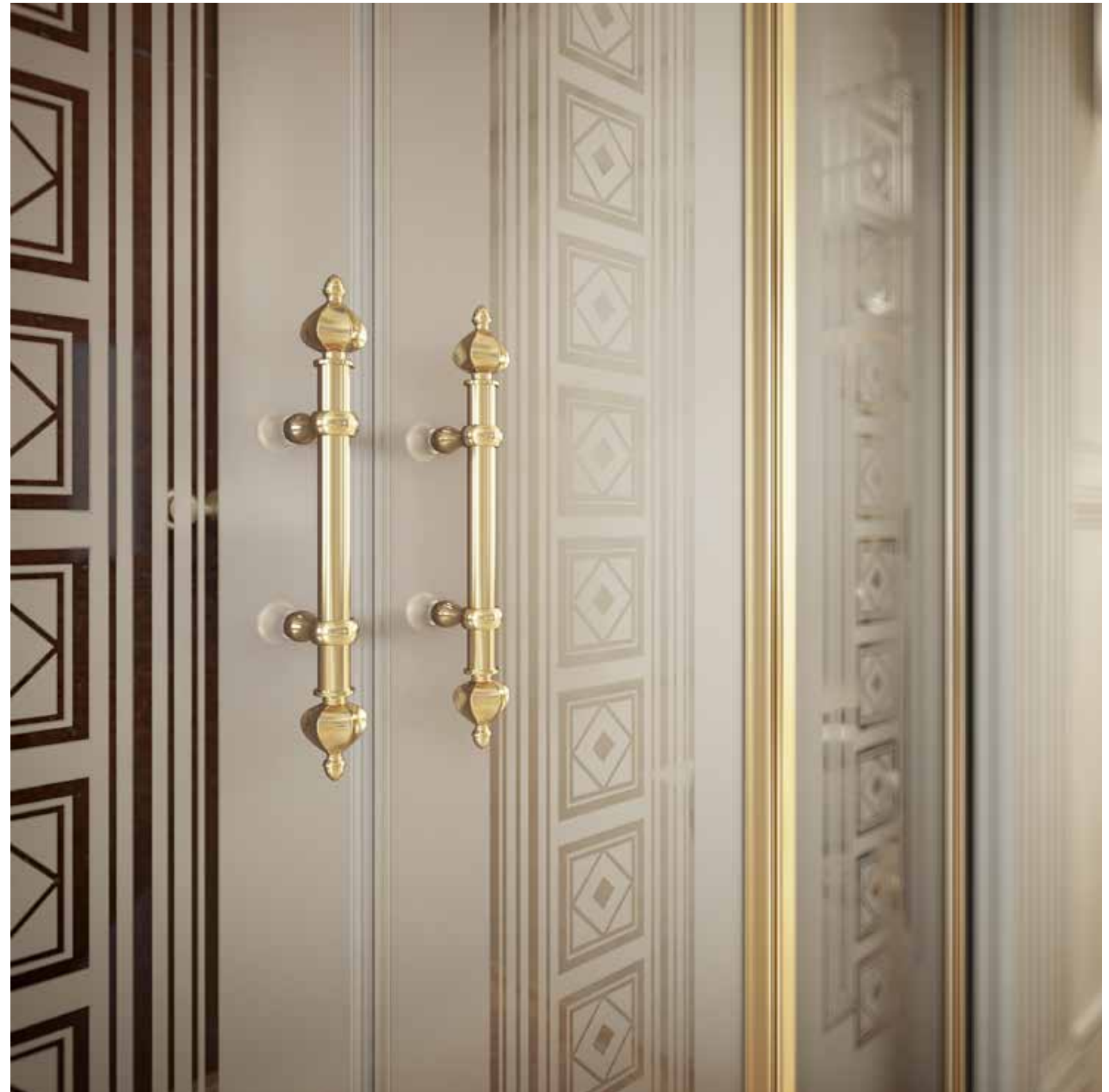
KE PZB 200 DRX SR4 oro chiaro | light gold | Светлое золото