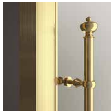
DRX oro chiaro light gold Светлое золото