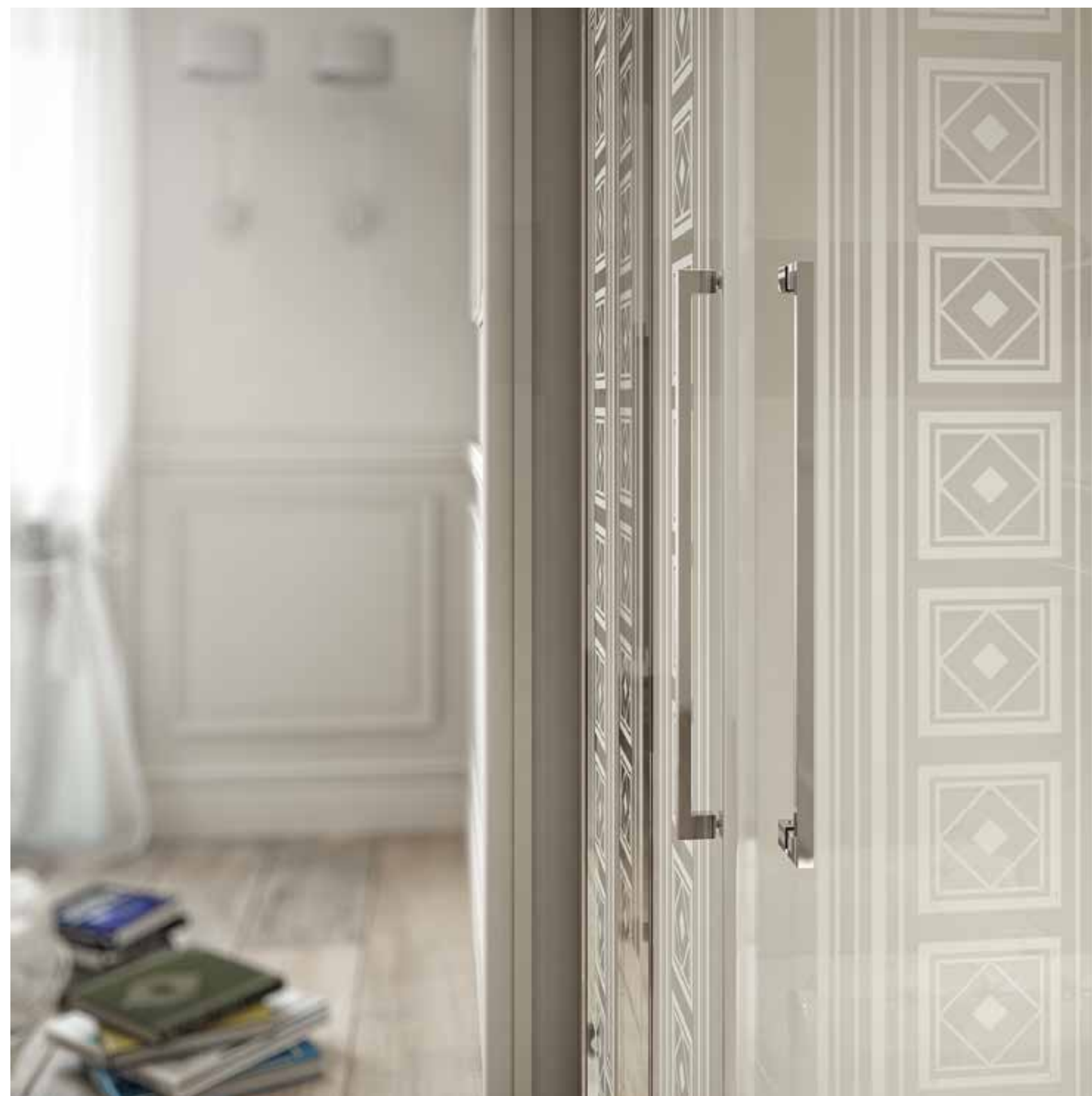
VE ALR 80X80 BRI SR2 brillantato | brillant chrome | Глянцевый блеск