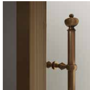
BRO bronzo spazzolato a mano hand-made brushed bronze Бронза, шлифованная вручную