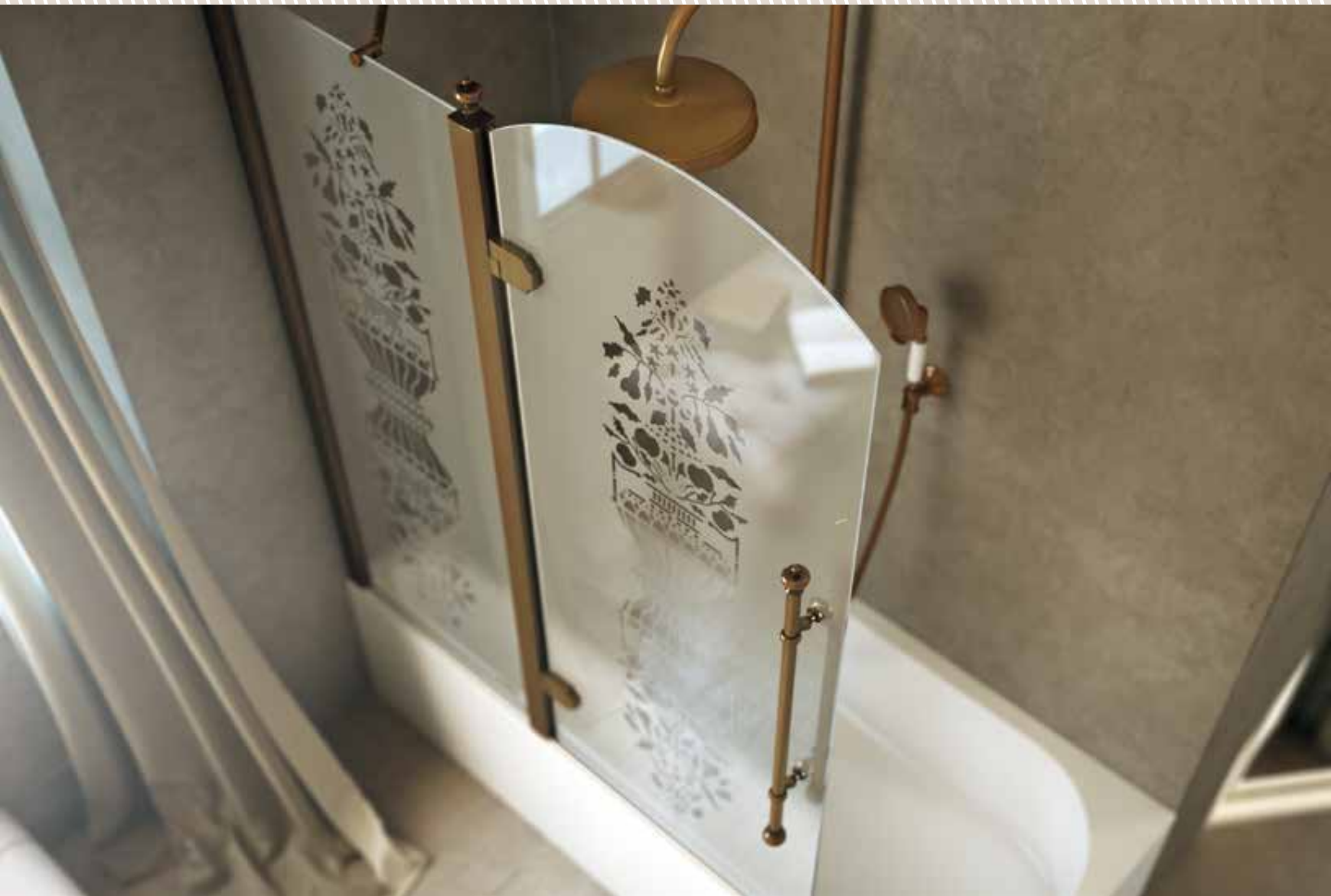
PP P2SS 125 BRO SR3 bronzo spazzolato a mano | hand-made brushed bronze | Бронза, шлифованная вручную