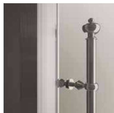
BRI brillantato brillant chrome Глянцевый блеск

Tutti i contenuti del presente catalogo sono di proprietà esclusiva di Box&Co. srl, i diritti sono riservati. È vietata la riproduzione non autorizzata, sia parziale che totale, del presente catalogo.