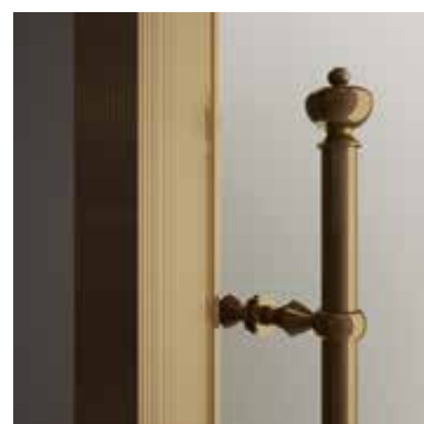
BRX bronzo bronze Бронза